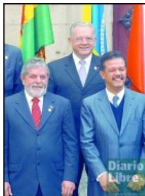
Leonel, Lula y el Vice de Guatemala.